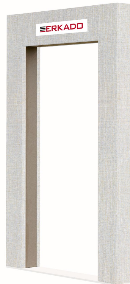
MATERIAŁ PŁATNY 210,00 zł* / 258,30 zł**